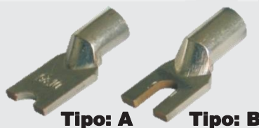
Tipo: A Tipo: B

Usando el cableado para alimentación a través del terminal del STC-25, el protector contra sobretensiones dará la conexión en serie